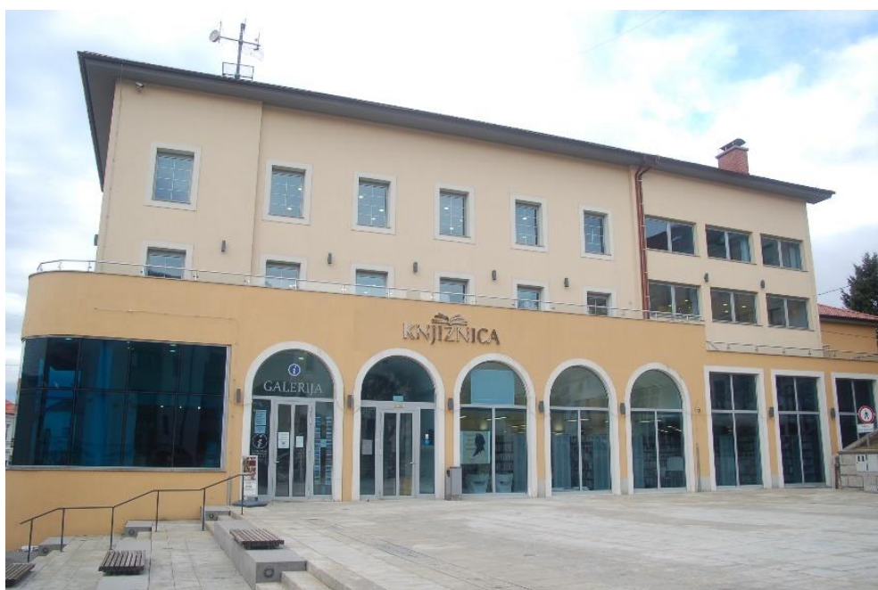
KNJIŽNICA BENA ZUPANČIČA POSTOJNA IN GALERIJA