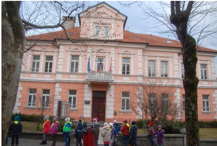
GLASBENA ŠOLA POSTOJNA