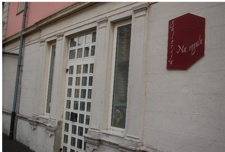
GALERIJA NA VOGALU