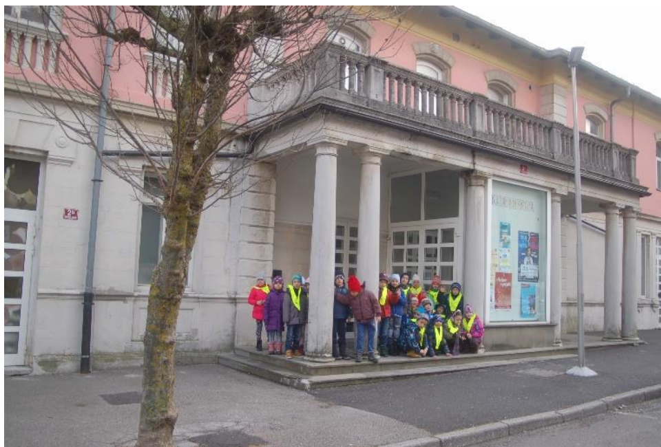
KULTURNI DOM POSTOJNA