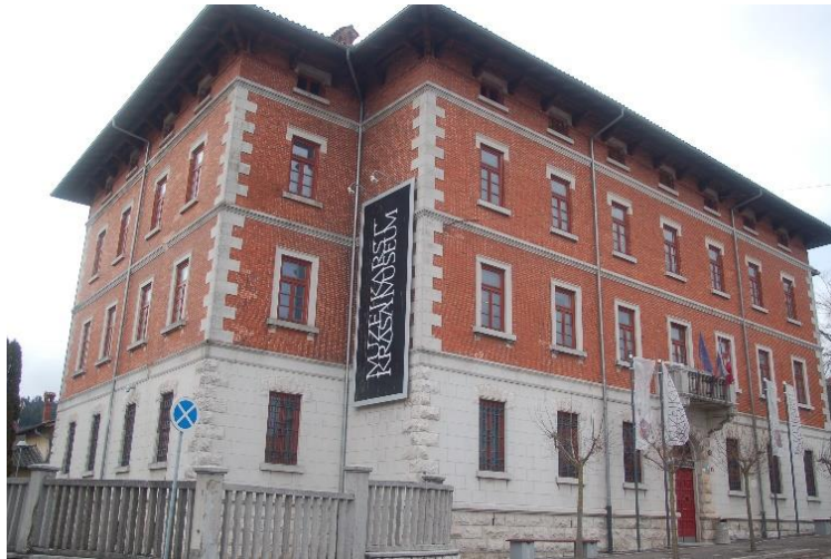
NOTRANJSKI MUZEJ POSTOJNA